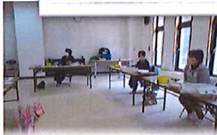
クリニカルアート講座