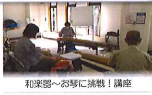
和楽器～お琴に挑戦！講座