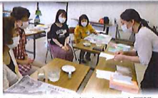
やってみよう！初めての日本画講