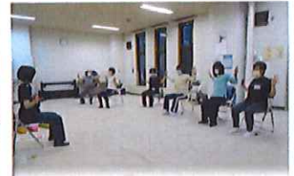
自宅のできる簡単な運動講座