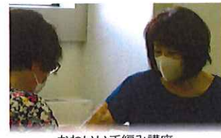
かわいい手編み講座