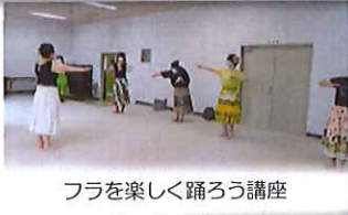
フラを楽しく踊ろう講座