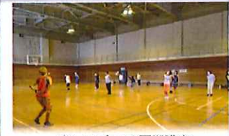
楽しいズンバ 夏期講座