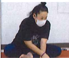
ヨガ入門 夏期講座