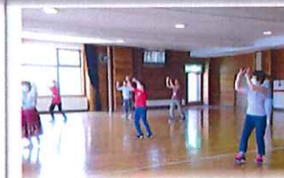
笑顔をつなぐフォークダンス講座