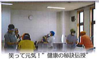
笑って元気！”健康の秘訣伝授” ラフターヨガ講座

筆ペン講座・英会話講座・フォークダンス講座・お琴に挑戦！講座・リンパマッサージ講座・日本画講座・ズンバ夏期講座・運動講座・オカリナ講座・童謡と叙情歌講座・手編み講座は『緊急事態宣言』が発令され中断しましたが、6月22日から“再開”することができました。