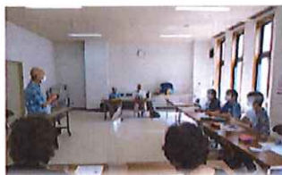
ゼロからはじめる楽しいオカリナ講座