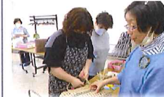
クラフトバンド講座