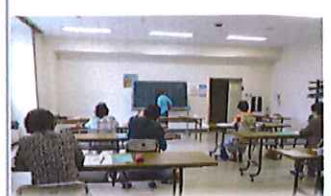
おとなの手習い筆ペン講座