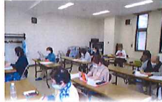
いちから始めるボールペン字講座