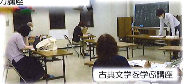
古典文学を学ぶ講座