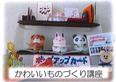
かわいいものづくり講座

コーヒーを1杯100円で提供しています！講座の帰り等、お気軽にお立ち寄りください♪ ※勤務中でありますので、大声を出さない等マナーを守って、楽しくご使用ください！