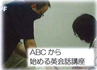
ABCから始める英会話講座

★6月1日（水）から6月受付講座が受付開始となります！ また、『SORA6月号』にも掲載しておりますので、 そちらもご覧ください♪