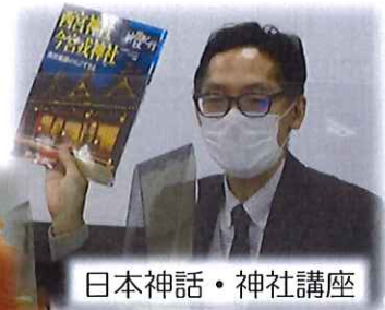
日本神話・神社講座