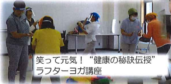
笑って元気！“健康の秘訣伝授”ラフターヨガ講座