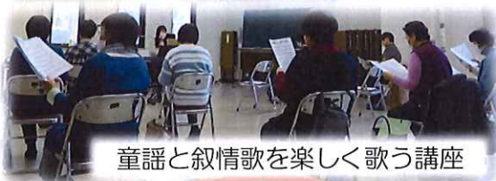
童謡と叙情歌を楽しく歌う講座